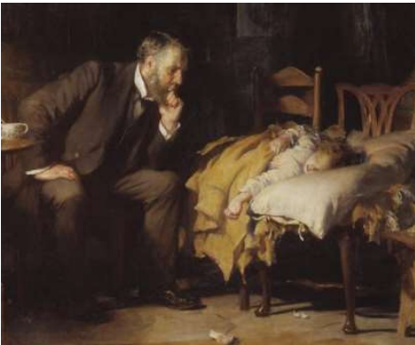
Luke Fildes (1843-1927), The Doctor , 1891, huile sur toile, Tate Museum.

L'épidémie sévira sans interruption jusqu'à mi-septembre. Aucun traitement des déjections et des eaux usées n'existait à l'époque. Tout se retrouvait dans la rue, les canaux, les fleuves, dans lesquels on puisait l'eau pour la consommer. En guise de traitement, la médecine préconisait alors des bains de jambes, des sinapismes (cataplasmes à la farine de moutarde), et des infusions de fleur de guimauve, bien évidemment sans action sur ce fléau. Les médecins, perplexes , soupçonnaient cependant sans pouvoir encore l'expliquer un lien entre les conditions de vie insalubres et la maladie.