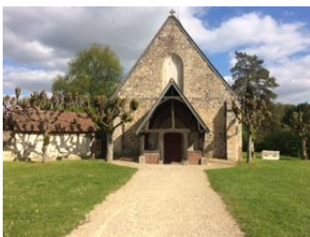
L'église Saint Rémi de Senots

Il en est de même pour les graffitis des arrêts de bus des 2 villages. Ces derniers sont régulièrement souillés. Un nettoyage et une mise en peinture s'avèrent plus que nécessaire !